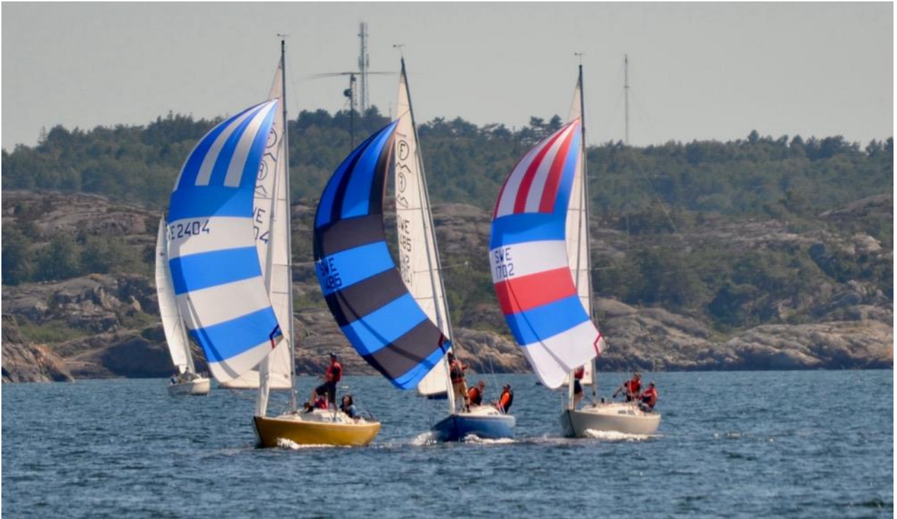
Nr 1, 2, och 3 på SM i Lysekil 2024.